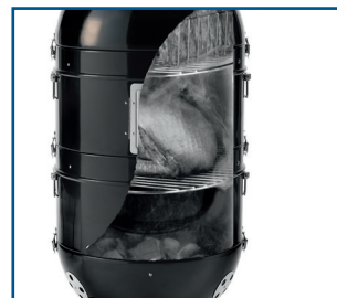
im unteren Bereich befinden sich der Kohlekorb und die Wasserwanne