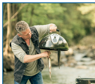
integriertes Gestänge und 5 Fleischhaken im Deckel