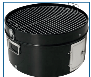
jede Grillkammer ist mit einem verchromten Grillrost ausgestattet