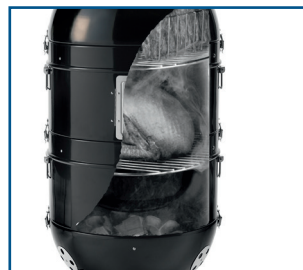
im unteren Bereich befinden sich der Kohlekorb und die Wasserwanne