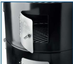
Türen für einfachen Zugang zum Grillgut auf jeder Grillebene